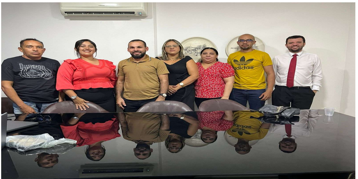
Treinamento para certificação do conselheiro Fiscal RPPS.