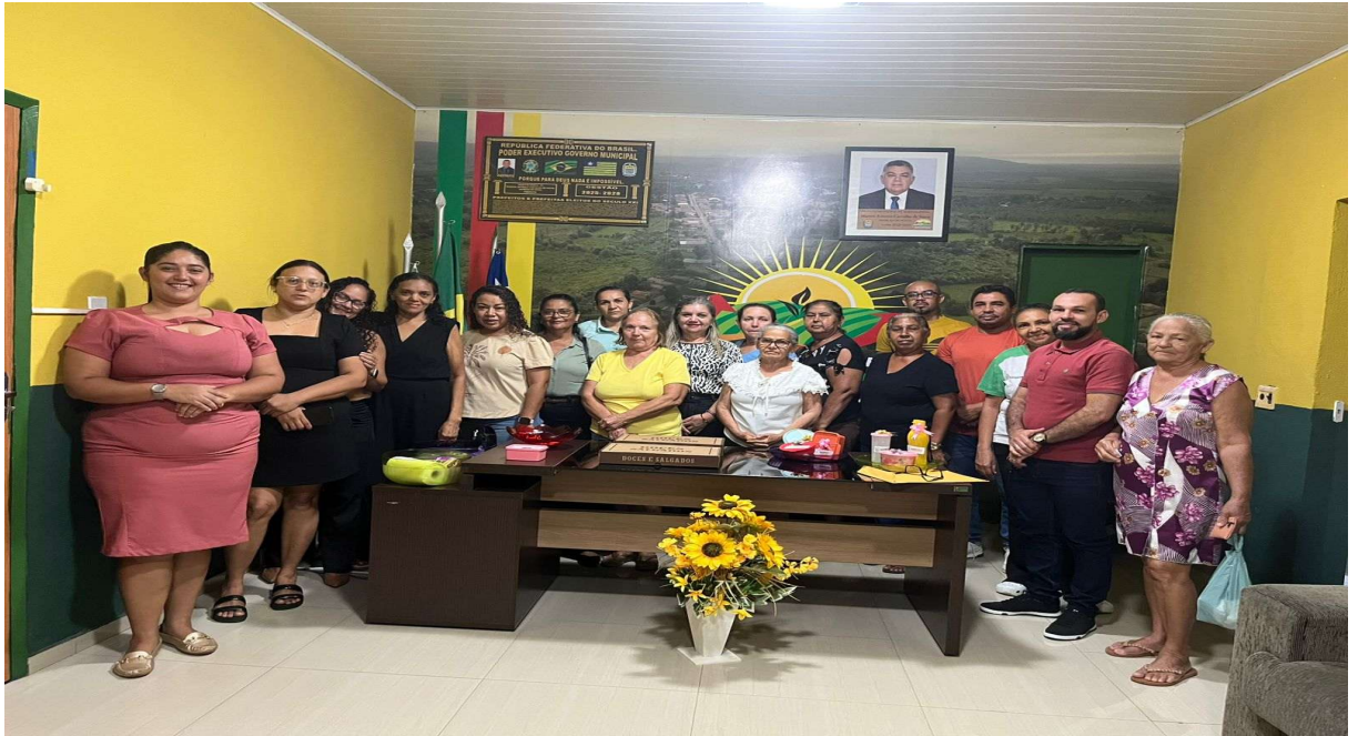
Reunião conselho deliberativo e fiscal com a presença da controladora municipal